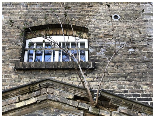
Vridsløse - når kultur og natur går i et

Fængselsområdet hedder nu Vridsløse, og det har været centralt i årets arbejde. Processen skrider frem, og sammen med Vridsløselille Fængsles Venner (VFV), hvor vi har en plads i bestyrelsen, er vi engageret i udviklingen af området. VFV er en slags paraplyorganisation, der tager selvstændige initiativer, men hvor der også er rig plads til, at vi selv kan handle. Og det gjorde vi f.eks., da vi ventede på kommunens forslag til Masterplan. Da lavede vi vores eget forslag - både for at holde debatten i live, og for at påvirke Vridsløses fremtid.