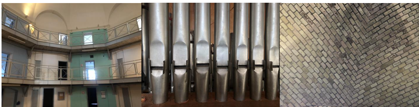
Panoptikon – centrum i fængslet

Der er nu lagt op til, at foreninger som os kan lave aktiviteter i området i de kommende 3 år. Det vil vi meget gerne, og har derfor til en start en forespørgsel ude om at låne Inspektørboligen til møder. I regi af VFV blev der bla. arrangeret en Corona-udsat Nytårskur og udgivet et nyt hæfte med sort/hvid fotos fra området.