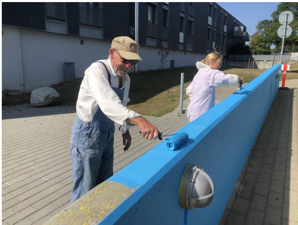
Vand-muren i Kanalen står også flot i ren blå

Bydiversitetsplakaterne har aldrig været den store sællert, så nu er tiden inde til i stedet at lave en Temaplakat – den første bliver fra fængslet.