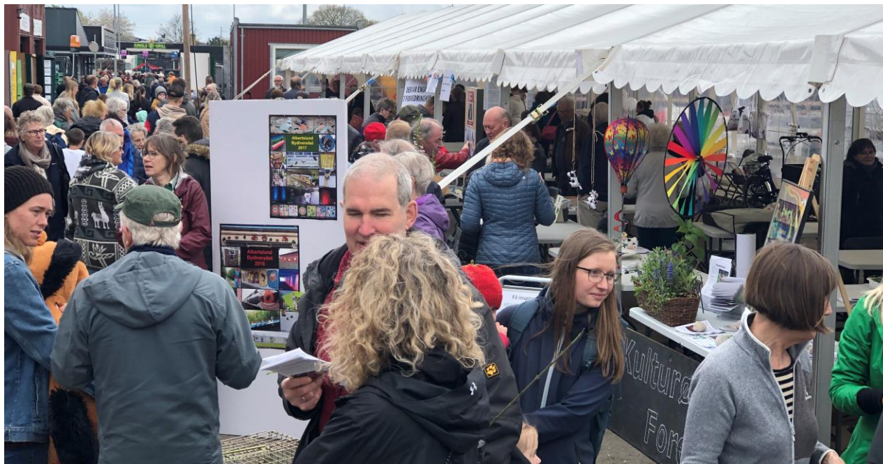
Der er altid lidt ekstra farver når KØF har en bod på Grøn Dag