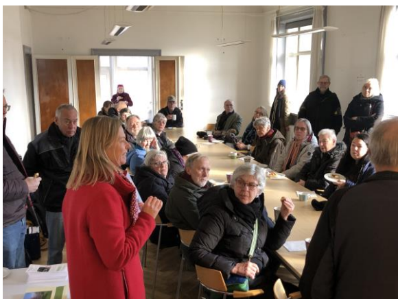
Arrangement i Inspektørboligen

Da kommunens forslag til Masterplan så kom i høring, lavede vi et omfattende hørings svar. I korte træk lægger vi vægt på at bevare de centrale historiske bygninger, skabe en bypark, gøre området åbent for alle, etablere en cykelbro over banen, skabe et bæredygtigt og varieret kvalitetsbyggeri og få lavet aktiviteter på området. Ideelt ser vi gerne en bebyggelsesprocent på 50, men lige der får vi ikke vores vilje. Den bliver nærmere 100. Til gengæld bevares bygningerne omkring porten med spiret, forboligerne, inspektørboligen, og bagboligerne. Samtidig bevares selve fængslesformen. Fløjene bliver godt nok revet ned, men nye bygninger bliver opført på samme sted. Entreprenøren siger også, at