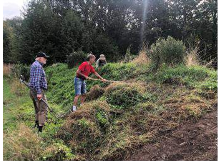
Mange gode hænder giver et nap med i Biotopia