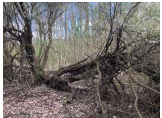
Stor biodiversitet på Radiogrunden

Vi skal ikke fælde skoven, bare fordi vi kan! Ét er, at Miljøstyrelsen nu har givet os lov til at fælde Vestskoven på Radiogrunden, men det er ikke ensbetydende med, at vi skal!... Vores bys "udvikling" skal ikke ske på bekostning af skoven... Tværtimod – den gode langsigtede, bæredygtige udvikling er at finde løsninger, hvor byen får mere natur og flere træer, samtidig med at indbyggertallet stiger... Hvis der er nogen, der skal forsvare Vestskoven, er det os i Albertslund!