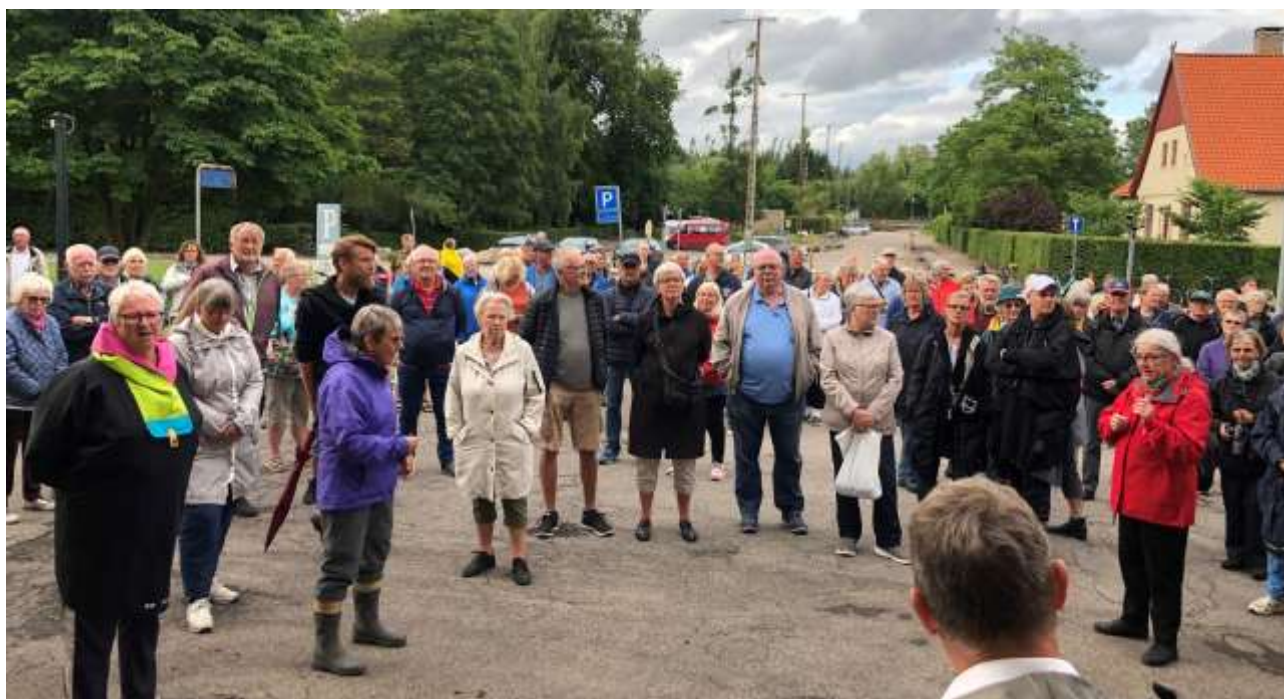
Rundvisningerne ved fængslet var populære