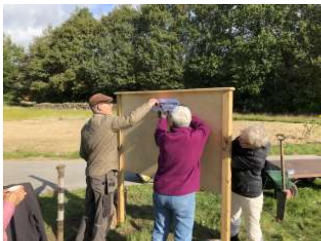
Info-tavlen tages i brug

Biotopia er en del af projekt ”10 % mere natur i Albertslund”. I Biotopia i Birkelundparken demonstrerer, underviser og inspirerer vi til mere biodiversitet. I de 7 måneder fra april til oktober,