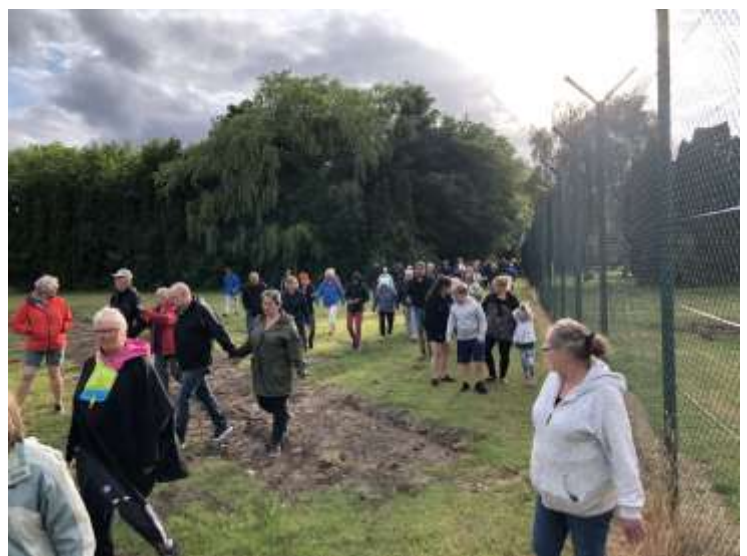
Mange deltog i vores rundvisninger ved fængslet