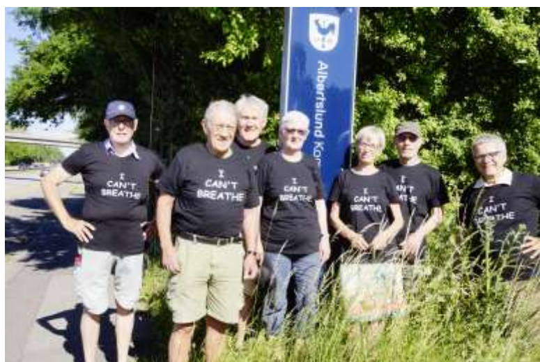
I Can't breathe holdet

I KØF vil vi gerne vise solidaritet og gøre opmærksom på, at vi aldrig skal tage tingenes tilstand for givet. Derfor stillede vi os op ved byskiltet med trøjer påtrykt "I can't breathe" og tilføjede: "I Albertslund kan vi godt trække vejret - og det skal vi, ved fælles hjælp, kunne blive ved med!"