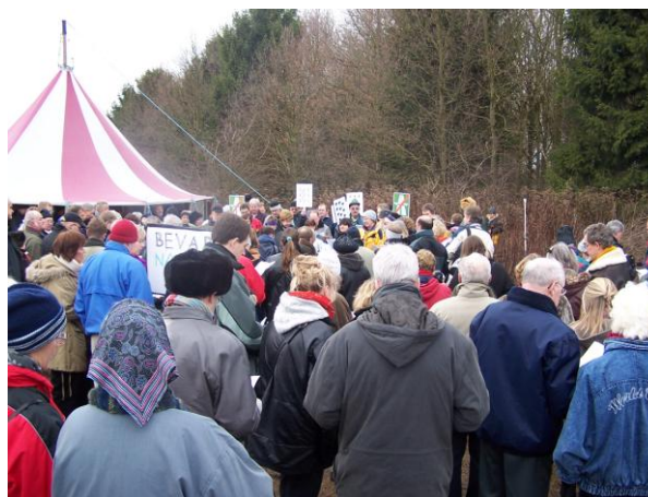
Fra vores demonstration i 2004 ”Ja til Vestskoven – Nej til mere Motorvej”

Til receptionen vil vi også offentliggøre vores aktivitetsprogram frem til sommerferien. Vi har forberedt en perlerække af arrangementer – nogen nye, andre ”gamle” - der trækker tråde tilbage til foreningens 20 års virke. I får det hele her: