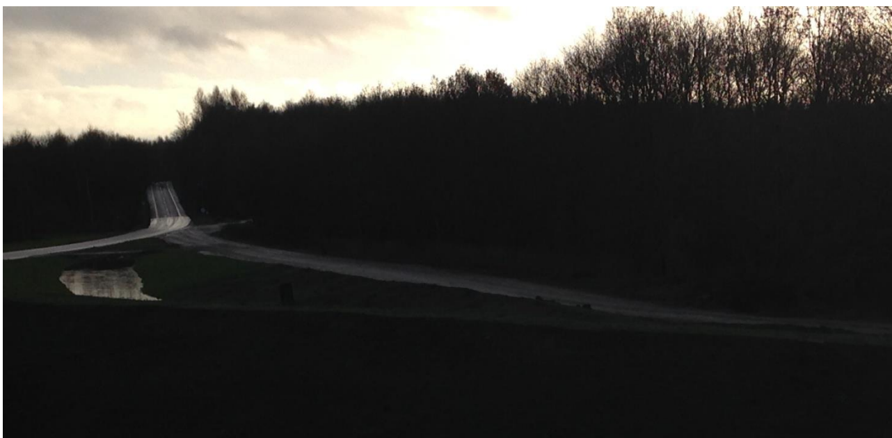
Fotoet viser Ballerupvej (set mod syd - mod Risby) fra den nye vejbro over motorvejen. Vejen til højre er et stykke af den gamle Ballerupvej – før den blev omlagt over motorvejsbroen.