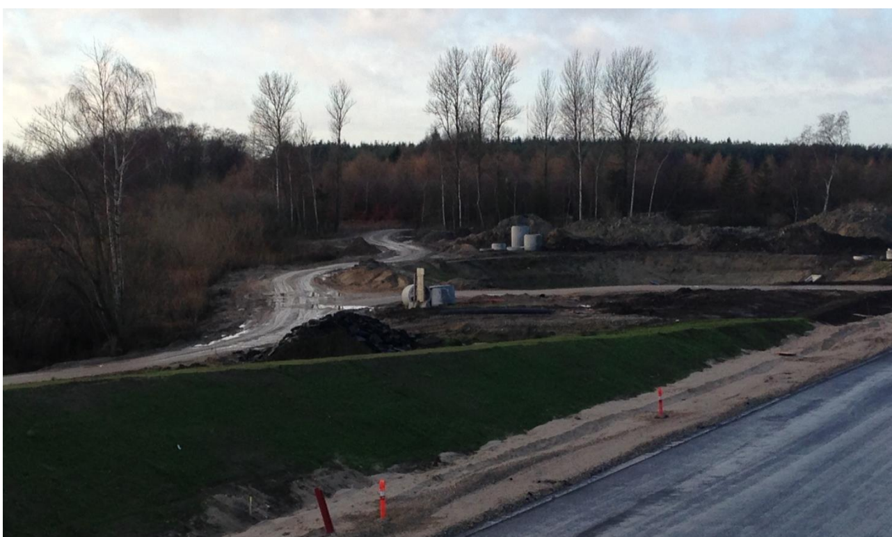
Fotoet er taget fra Ballerupvejens bro over motorvejen. Den slyngede anlægs-grusvej ind mellem træerne er en forlængelse af den gamle Ballerupvej (se foto ovenfor). Vejen er næsten 2 km lang og går på sydsiden af motorvejen. Der mangler kun 100 meter for at få forbindelse til stibroen ved Margrethelund.