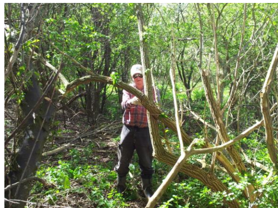
Bestyrelsen den 4.9.12