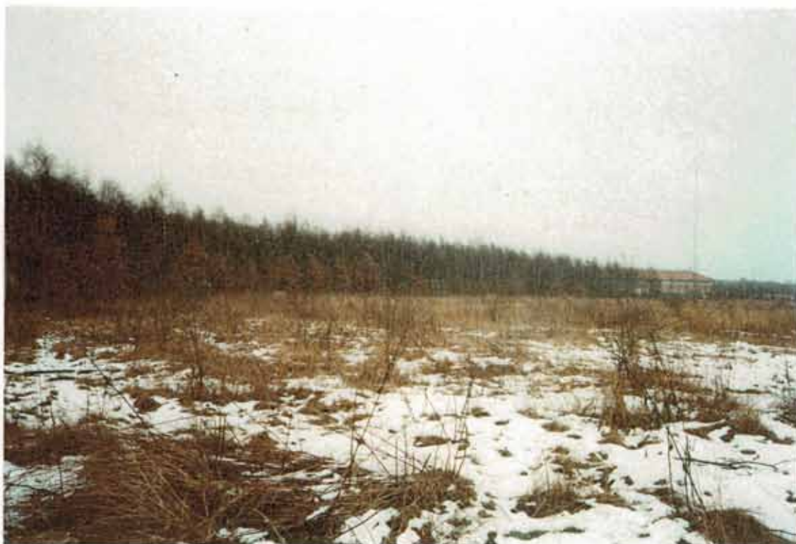
Hyldemarken med politistationen i baggrunden inden vi tog fat

2/3 af arealet havde ligget uberørt hen i 20 år. Det betød højt ukrudt, masser af buske og enkelte småtræer. Den sidste tredjedel var blevet dyrket af den bondemand,