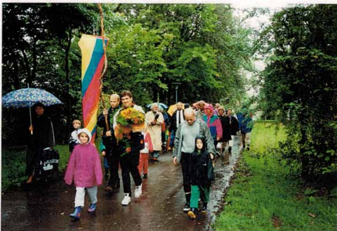
Høstfestoptøget på vej til marken i 1995