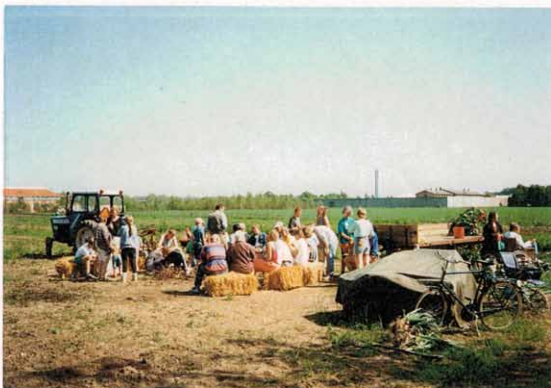
Komsammen på Hyldemarken

Også andre træer plantede vi på Hyldemarken. Flest bøgetræer - en lang række bøgetræer, men også nogle kastanjetræer. De skulle opsamle den CO 2 , vi udledte, når vi brændte diesel af i traktoren. Landbrug er jo dybest set en stor solfanger, der opsamler solens energi og omdanner den til brændstof i form af mad til os selv, så vi kan holde vores kroppe kørende. Et fundamentalt problem ved landbruget i dag er bare, at det bruger mere energi (i form af fossile brændsler) end det producerer (i form af fødevarer). Og videre udleder landbruget i dag mere CO 2 , end det binder. Det betyder med andre ord, at det moderne landbrug miljømæssigt er en underskudsforretning. Det tærer på naturens kapital. Det forvalter ikke kapitalen med omtanke og bæredygtighed. Det nedbryder den. Den grøft ville vi ikke falde i – så vi plantede træer!