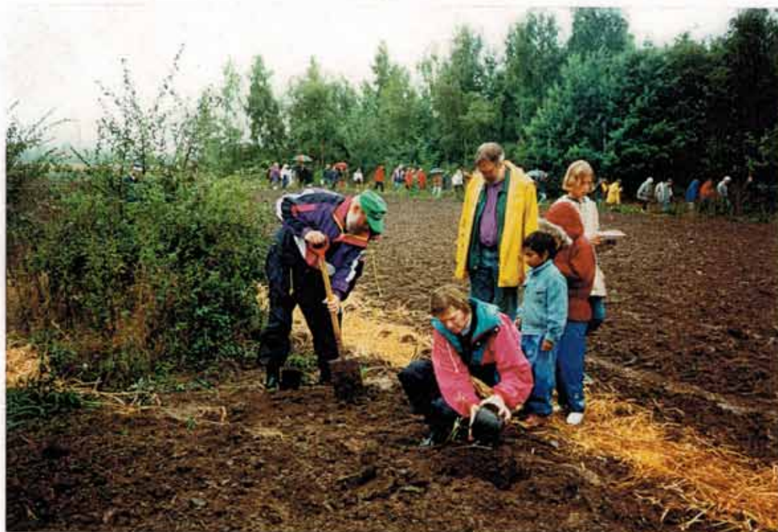
Der plantes CO 2 - neutrali- serende træer