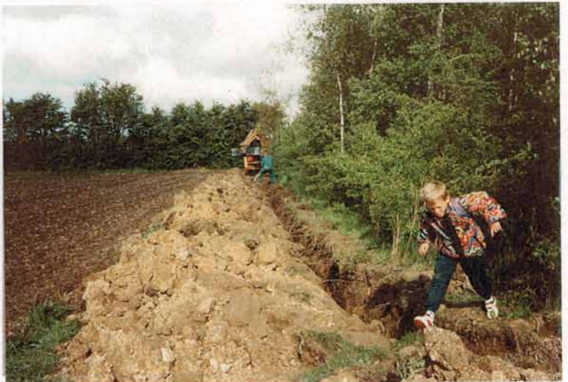
Vi får lagt vand ind

Anderledes gik det med kartoflerne. Da vi endelig var klar til at bestille læggematerialet, var det alt for sent og det eneste, vi stort set kunne få fat på, var aspargeskartofler – der har det ret dårligt med stiv lerjord, viste det sig. Men vi fik dem i jorden, hvorefter det blev tørke. Og først da vi havde fået installeret vand, begyndte det igen at øsregne!