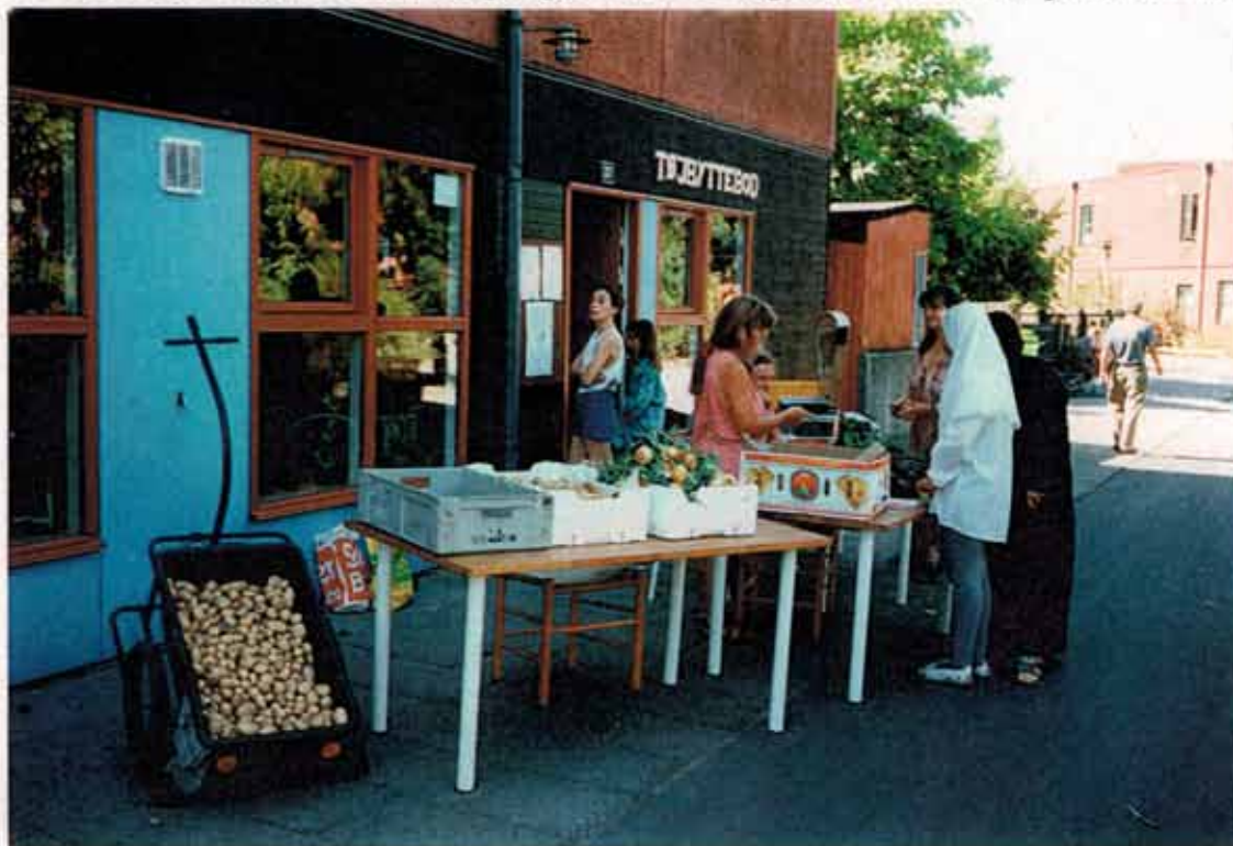
Udsalg fra Hyldebjergdets Tøjbyttebod

Efterhånden kom der også mere skik på organisationen. I starten var vi inddelt i aktive og passive medlemmer – at man kunne være passiv var for at tage hensyn til især dem, der havde været medlem af indkøbsforeningen Hyldeblomsten. De var ikke nødvendigvis mindede, for at luge ukrudt. De aktive medlemmer passede marken, høstede og solgte afgrøderne. Til gengæld fik de afgrøderne til halv pris. Det var for