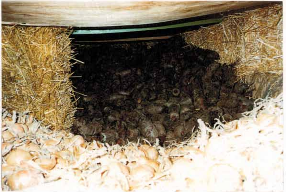
Kulen med løg og Rødbeder