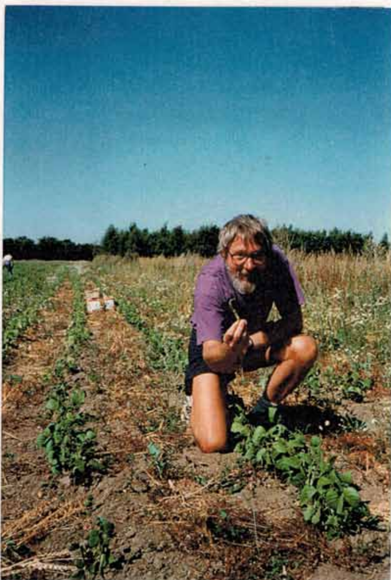
Lasse med årets første bonne

En ting kom dog bag på os hvert år og hele tiden: Vi skulle bare vende ryggen til og fluks var der ukrudt over det hele! Det gik sådan set meget godt i foråret og forsommeren, men så snart vi byboere synes, vi havde fortjent en sommerferie, så gik det galt. Sommerferie og ukrudt hænger ikke godt sammen. Det var altid en værre omgang at komme hjem til, og mange rækker spinat, bønner, gulerødder, squash og hvidløg er gået til på den konto; men til trods herfor har vi dog fået et rimeligt udbytte ud af vores anstrengelser og de vel nok 20 forskellige afgrøder, vi hvert år har haft.