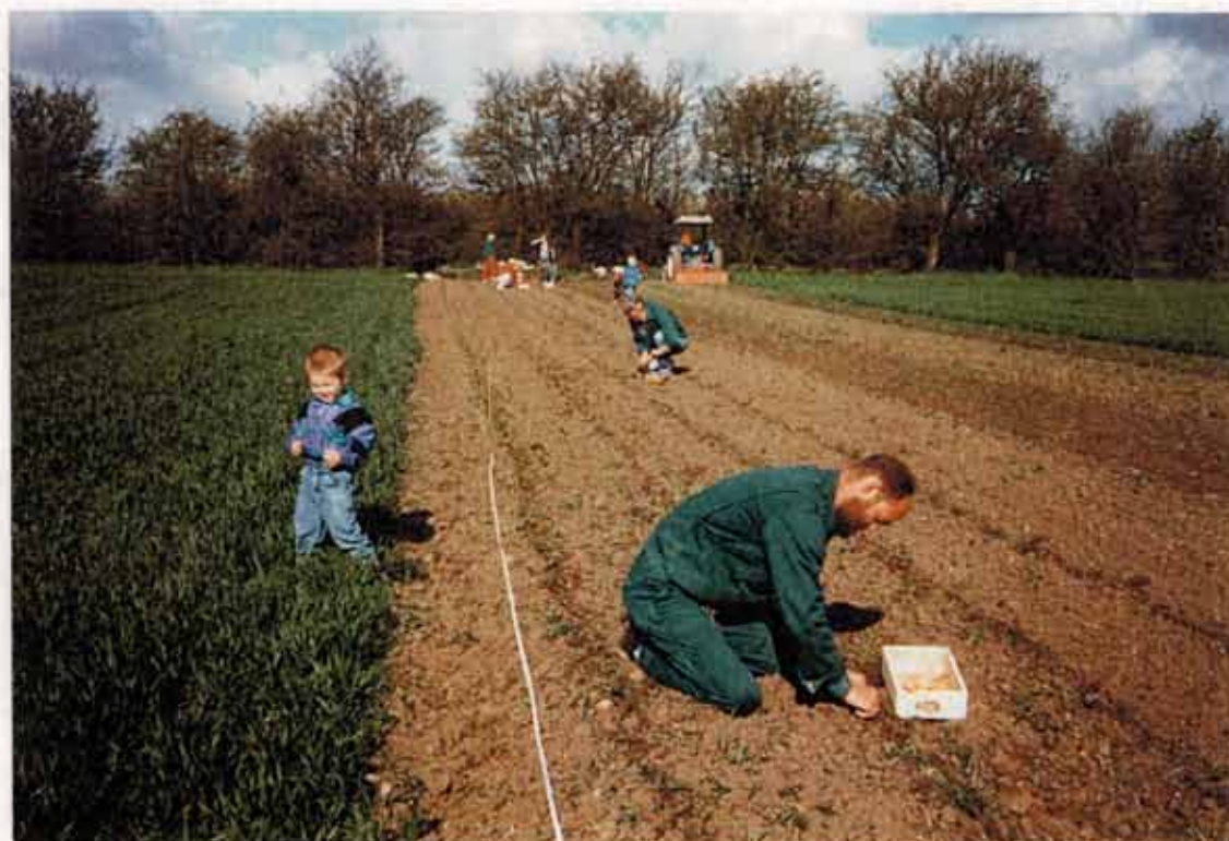
Løgene sættes i 1995