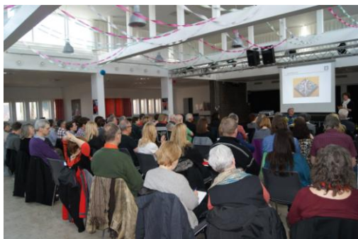
I Love Albertslund-konferencen

Demonstrationerne starter onsdag den 17. april kl. 19.00 ved Frihjulet i Vognporten – og så må vi se, hvor mange onsdage det bliver nødvendigt at fortsætte..